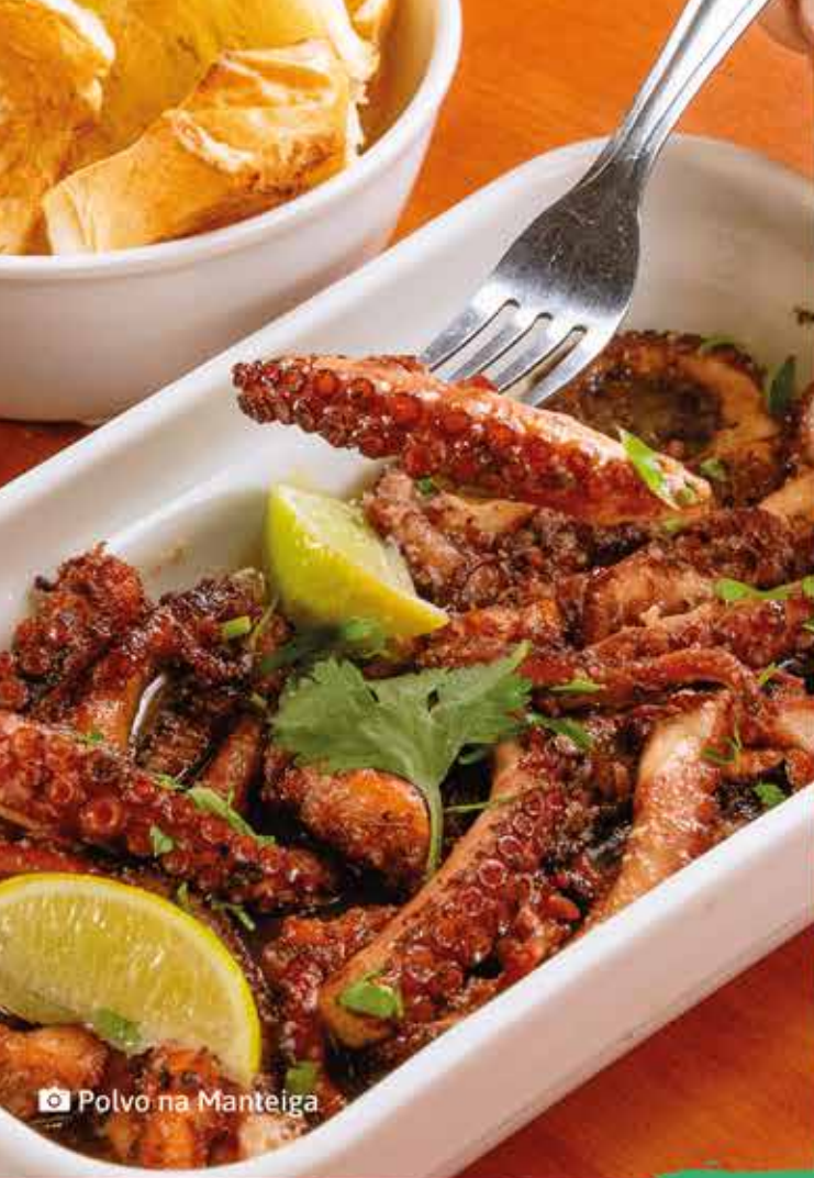
📷 Polvo na Manteiga