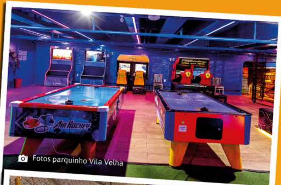
Fotos parquinho Vila Velha