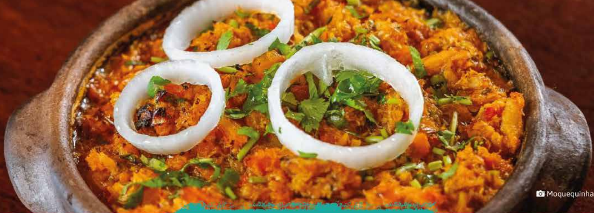
Moquequinha de Siri