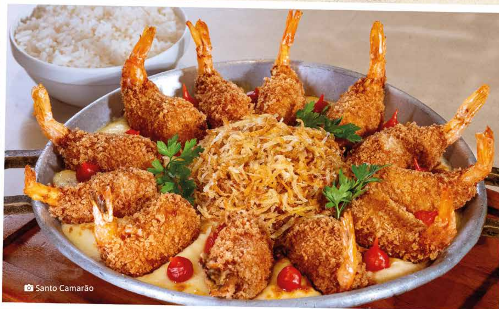
📷 Santo Camarão

Camarões VM empanados (2 pessoas: 6 unidades / 4 pessoas: 12 unidades) e recheados com Catupiry, sobre um creme de queijo com Camarões Especiais flambados (2 pessoas: 230g / 4 pessoas: 460g) com ervas, lascas de bacalhau, toque de siciliano e finalizado com batata palha feita na casa. Acompanha arroz branco.