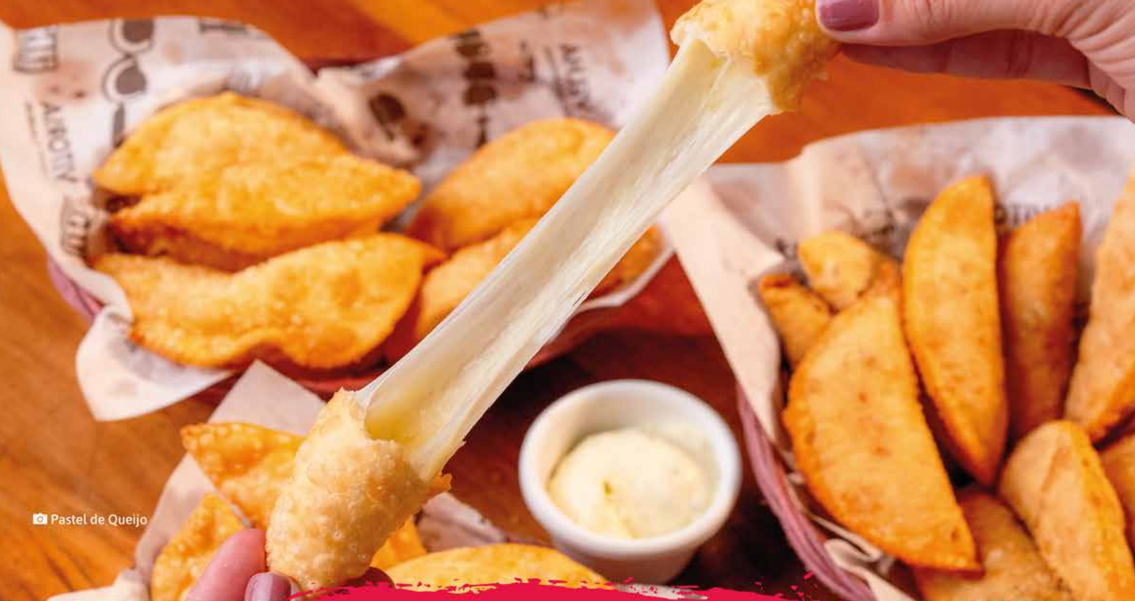
📷 Pastel de Queijo