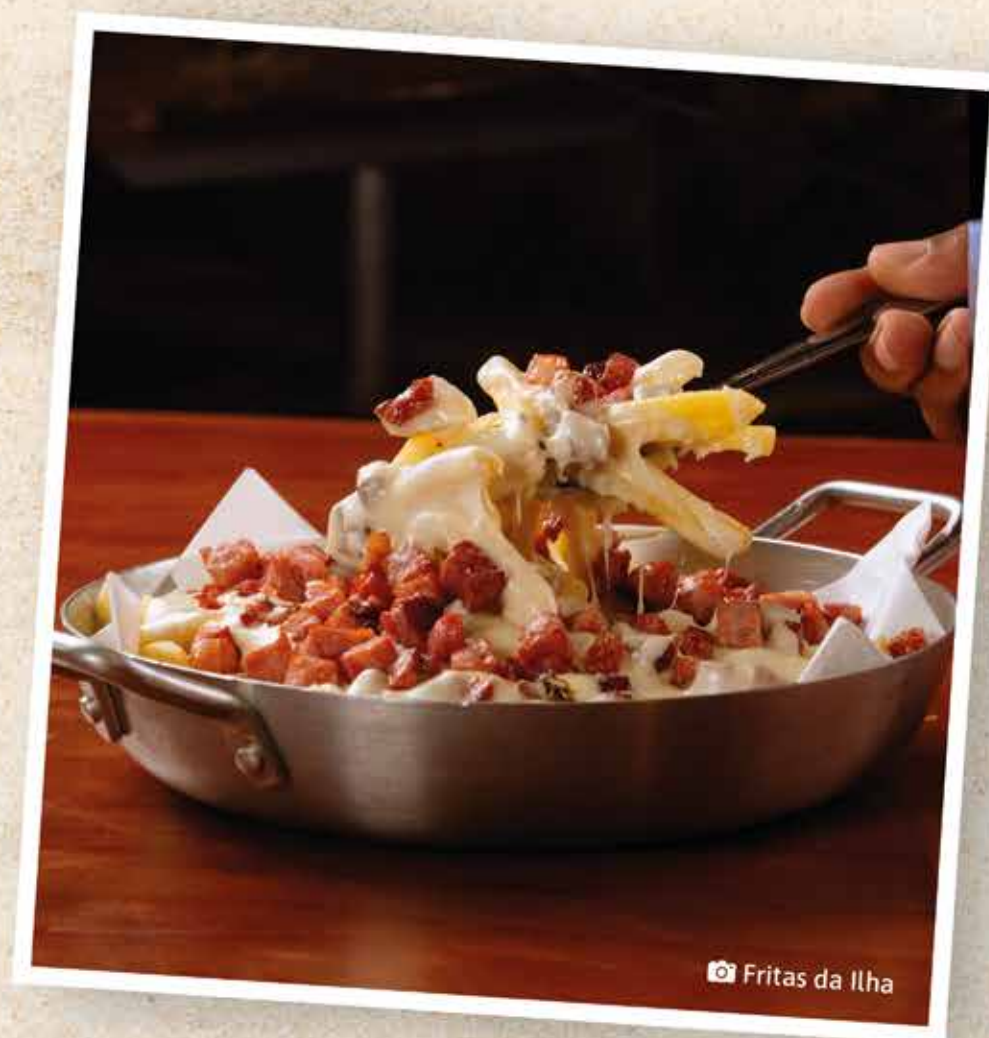
📷 Fritas da Ilha

200g de Lula empanada, 200g de Camarões com casca marinados na cerveja, ervas e especiarias, fritos e crocantes e 300g de Gorjão de Peixe, juntos numa mesma porção. Acompanha maionese da casa.