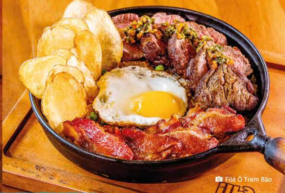
📷 Filé Ô Trem Bão