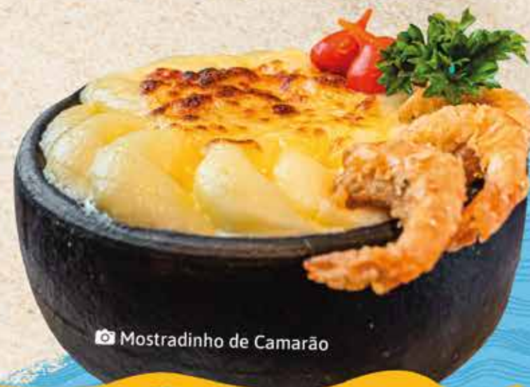
Mostradinho de Camarão

Tradicional salada de alface, croutons, queijo parmesão em lascas, 230g de camarões especiais e delicioso molho caesar.