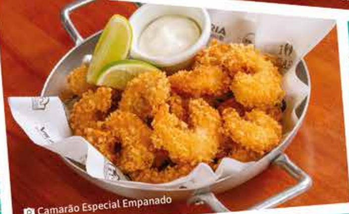
📷 Camarão Especial Empanado