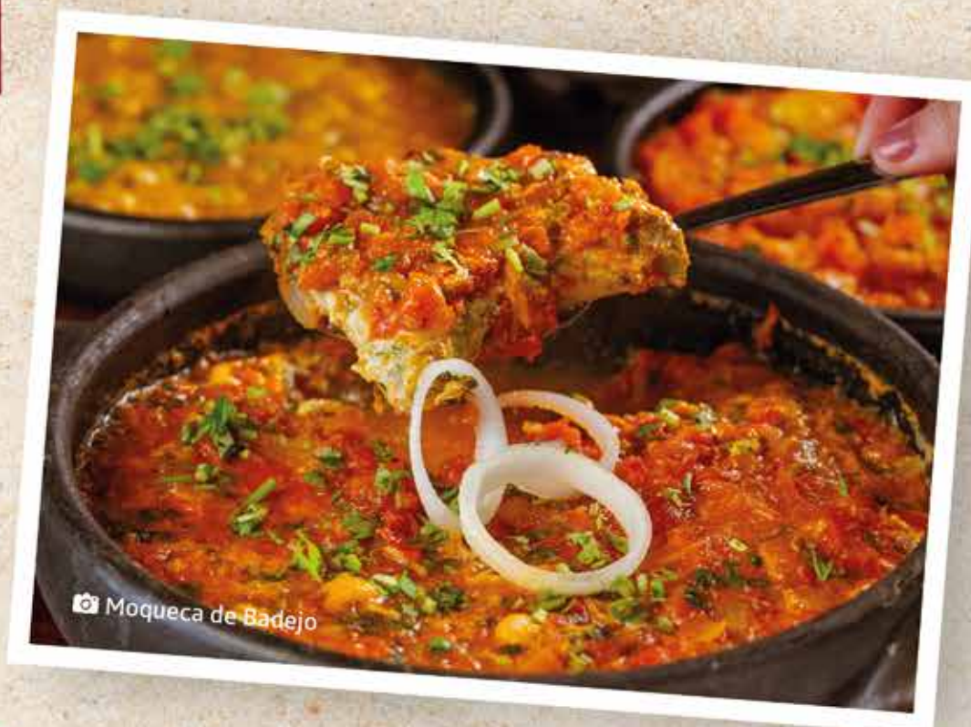
Moqueca de Badejo