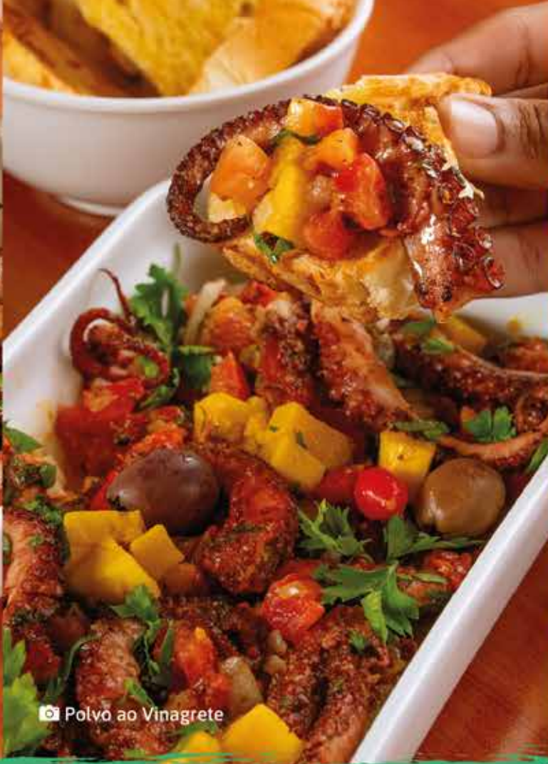
📷 Polvo ao Vinagrete