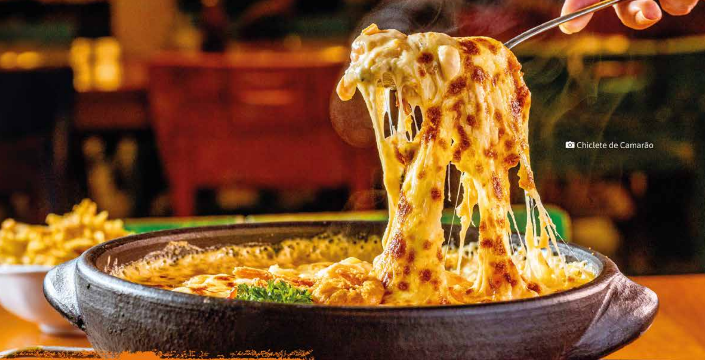
📷 Chiclete de Camarão