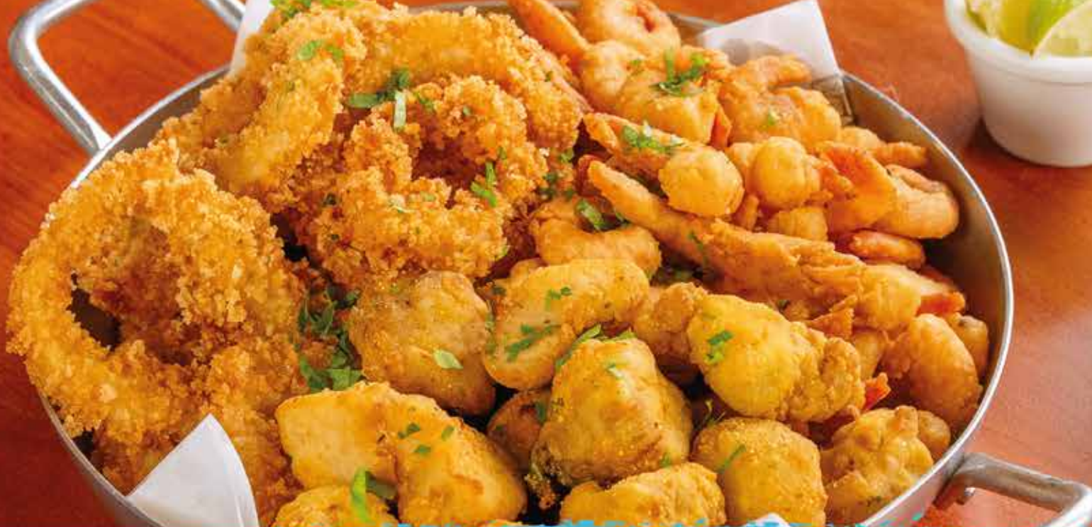
📷 Trio Elétrico do Mar