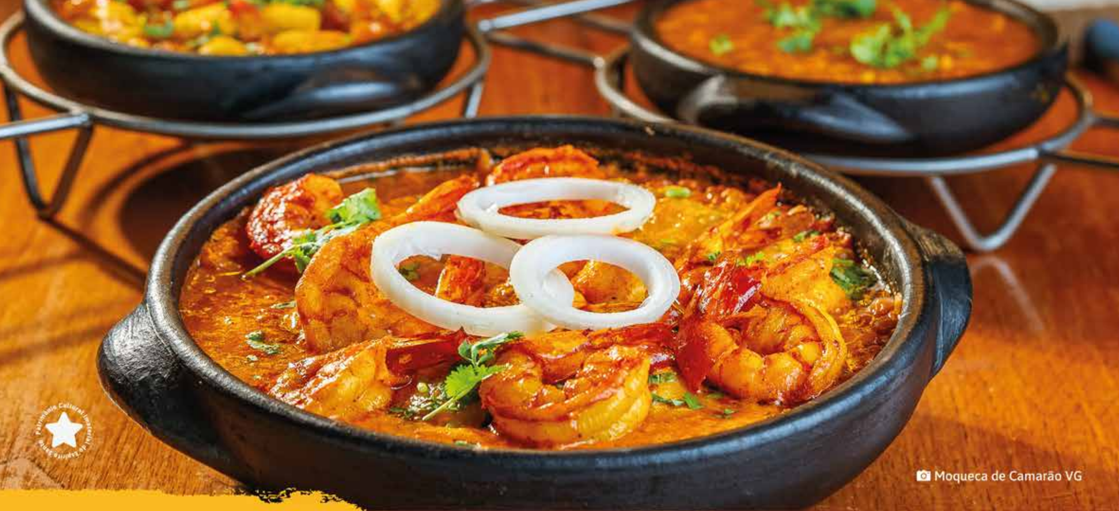
📷 Moqueca de Camarão VG