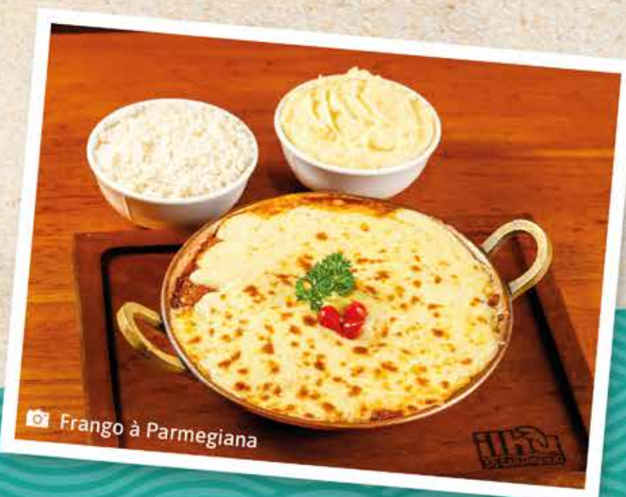
📷 Frango à Parmegiana