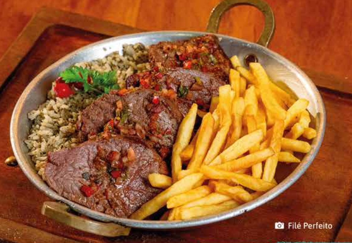
📷 Filé Perfeito