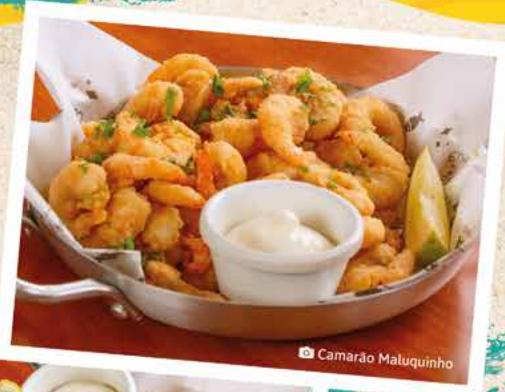
📷 Camarão Maluquinho