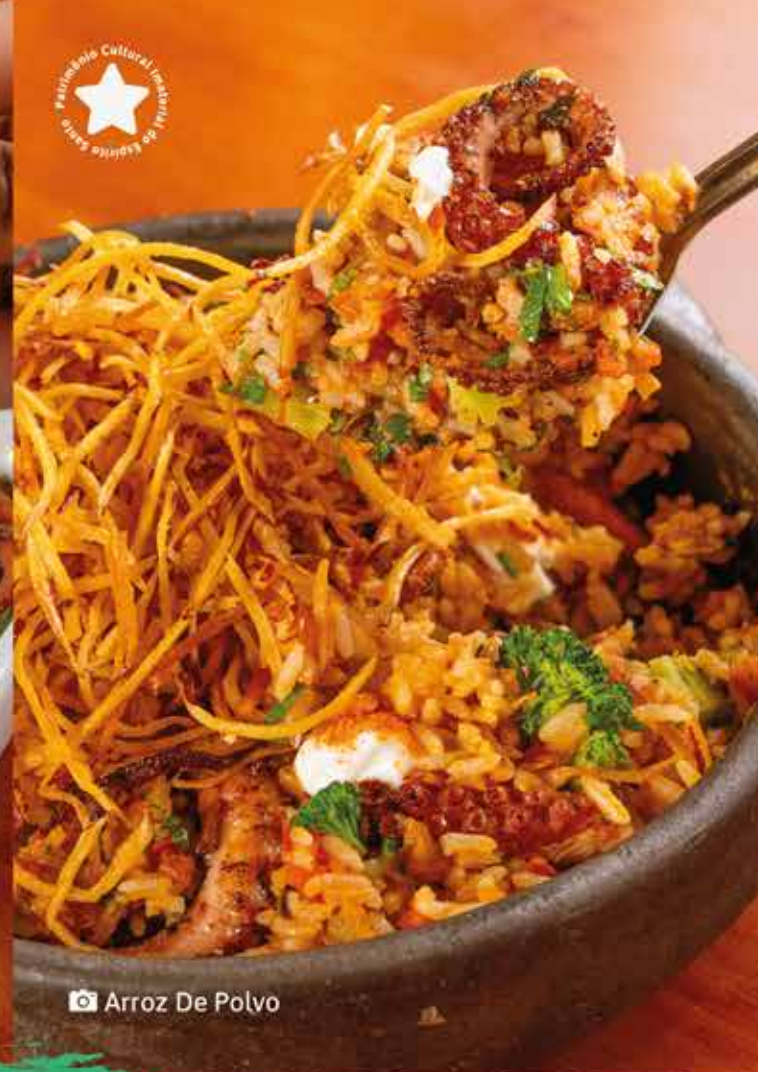
📷 Arroz De Polvo