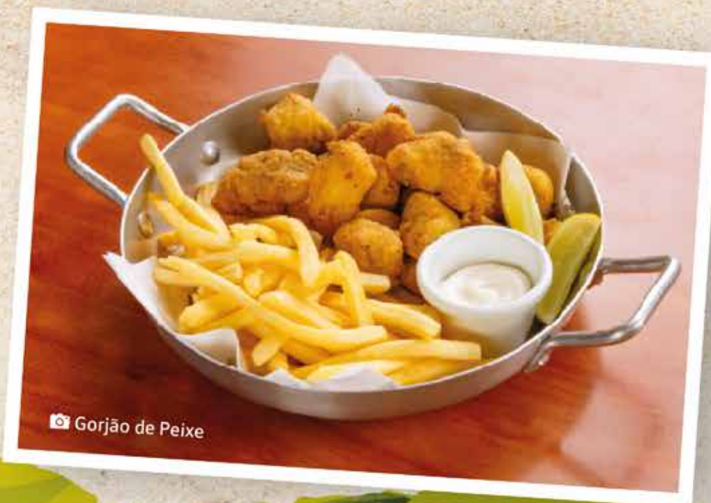
📷 Gorjão de Peixe

1,3kg de Robalo fritinho com 3 espetos de Camarões especiais empanados e fritos, farofa de banana, 300g de fritas com molho bechamel com queijo e bacon. Acompanha arroz e vinagrete.